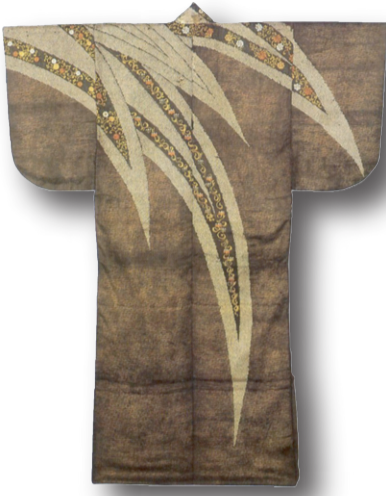
Stilize edilmiş yaprak desenli, Kosode