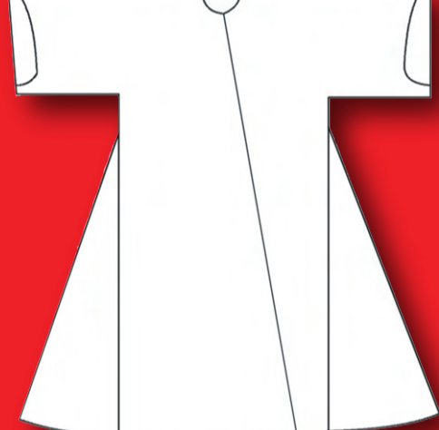
II. Osmana ait Kaftan Teknik Çizimi Ön Görüntü