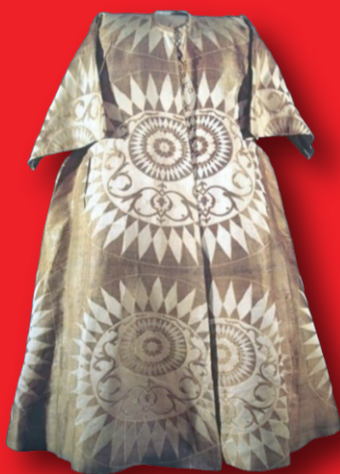
II.Selime ait, büyük güneş motifli, tören kaftanı