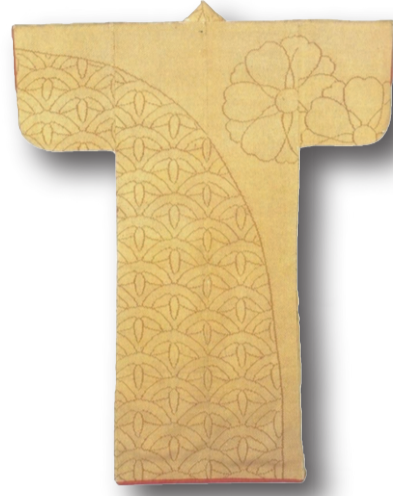
İpek kosode, Tokyo National Museum