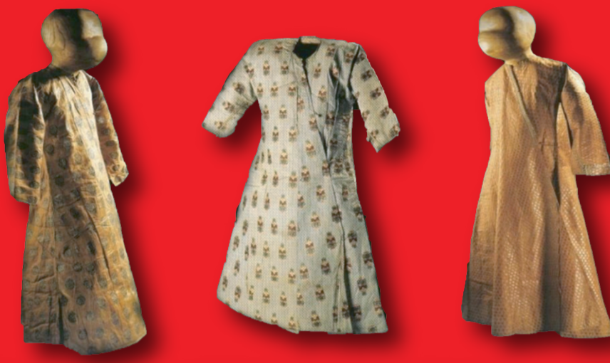
Savayi Kumaştan Yapılmış Çocuk Kaftanları (Topkapı Sarayı Müzesi, İstanbul)