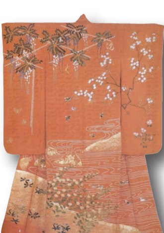
Kırmızı, figürlü, saten Furisode