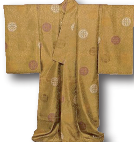
Günlük Japon Kimonosu