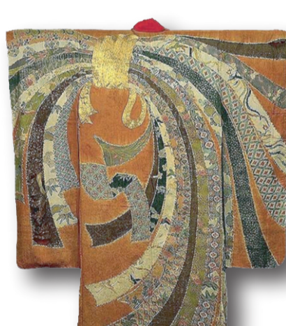
Yuzen ve shibori tekniklerinin bir arada kullanıldığı Furisode