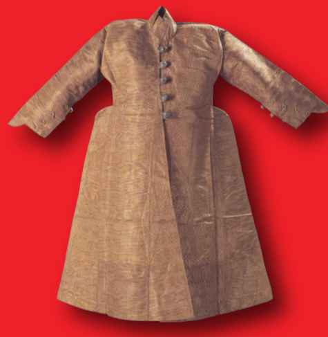
Yassı tel ve klaptanın birlikte kullanıldığı ipekliden dikilmiş çocuk entaris