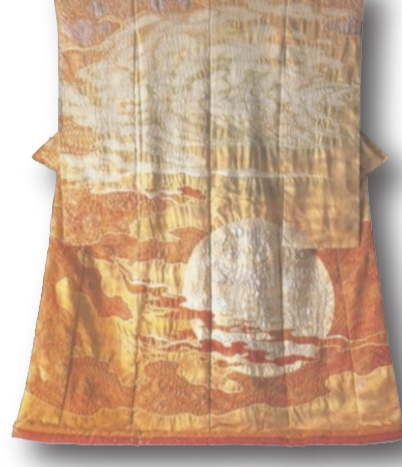
Japon Pano Desen Kimono, Tokyo Ulusal Müzesi