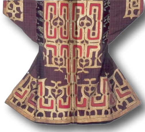
Farklı renklerde uygulanmış Applike