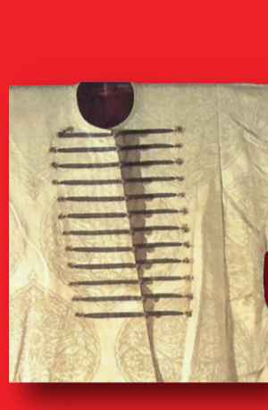
yaka ve ön kapama detayı