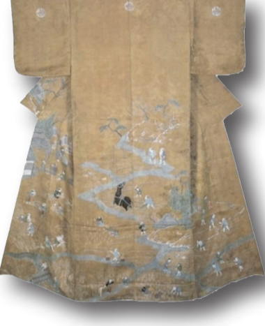
Dört mevsim çeltik tarlası deseni Kosodei

Japonya'da siyasi istikrarın sağlanmasıyla sanat ve zanaat alanında büyük gelişmeler yaşanmıştır. Renkli ve süslü kıyafetler bu dönemin simgesi haline gelmiştir. Özellikle samuraylar ve soylular arasında zengin desenlere ve renk paletlerine sahip kıyafetler tercih edilmiştir. Kimono'nun daha belirgin hale geldiği bu dönemde, obi adı verilen kuşaklar kıyafetleri tamamlayan önemli bir aksesuar olarak kullanıldı.