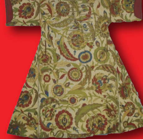
Sultan II. Bayezide ait sırmalı ipek kaftan