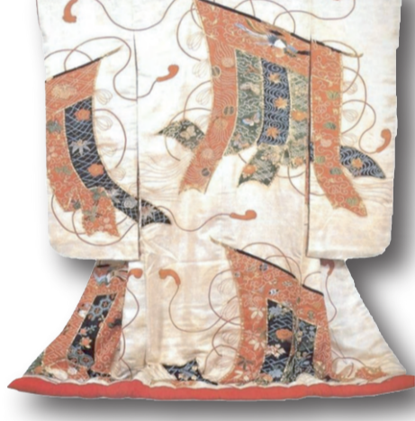
Beyaz, Figürlü, Saten Uçikake