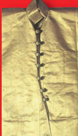
satın çocuk kaftanı