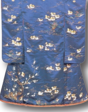
Pekin ördekleriyle ve dalgalı akarsu, iris ile süsülü Donsu uchikake. Japon Tarihi Ulusal Müzesi

Bu dönemde kimono, toplumun her kesiminde yaygın hale gelmiştir. Basit bir kıyafetten ziyade sosyal statü, cinsiyet ve yaşı gösteren bir sembol olarak kabul edilmiştir. Desenler ve renkler, giyen kişinin yaşına ve mevsime göre değişiklik göstermiştir. Bu dönem kimononun en çok gelişim gösterdiği ve sosyal statü belirleyici bir giysi haline geldiği dönemdir. Meiji Restorasyonu ile Japonya'da Batı kültürüne yönelik büyük bir açılım başlamıştır. Japon halkı, özellikle şehirlerde Batı tarzı kıyafetler giymeye başlamıştır. Ancak bu dönemde, kimono hala geleneksel Japon giysisi olarak saygı görmüştür.