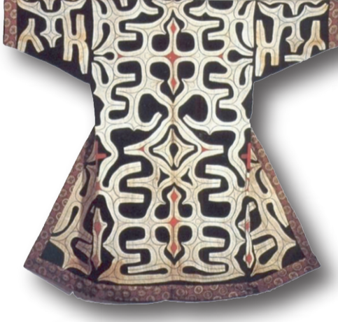
İşleme ile kombine edilmiş applike deseni

Japonya'nın modernleşme sürecinin devam ettiği bir dönemdir. Ancak toplumsal sınıflar arasındaki farkların belirginleştiği, kadın hakları ve işçi hareketlerinin ortaya çıktığı bir süreç olmuştur. Kıyafet kültüründe geleneksel ve Batı tarzı giysiler bir arada var olmuştur. Japonya'nın modernleşme, kültürel değişim ve teknolojik yenilikler yaşadığı bir zaman dilimi olarak tarihe geçmiştir. Kıyafetler de bu hızla değişen sosyal, ekonomik ve kültürel yapıya uyum sağlamıştır. Geleneksel kıyafetler hala korunmuş, ancak günlük yaşamda ve iş dünyasında batılı giyim tarzları yaygınlaşmıştır.