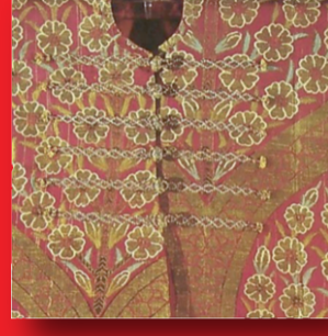
yaka ve ön kapama detayı