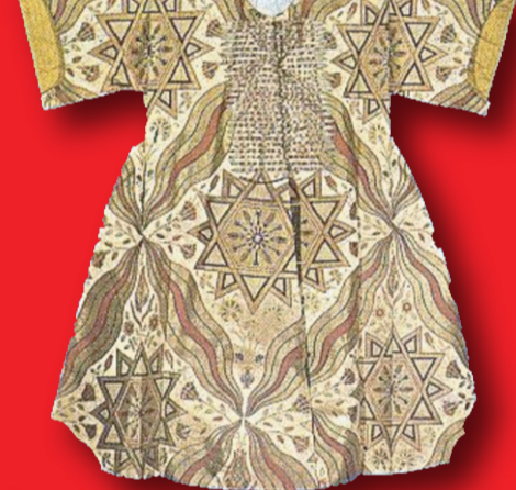
Fatih Sultan Mehmete ait sırmalı ipek kaftan